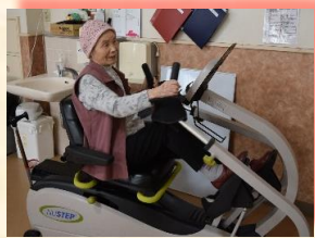
訓練室での リハビリ風景

⇒医師、看護師、管理栄養士、リハビリスタッフによる医療、介護福祉士による生活ケアを受けながら 自宅へ戻る準備をする施設 です。また、病院と違い退所しても、いつでもまた入所できることがポイントです。